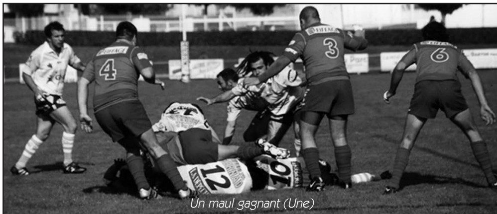
Un maul gagnant (Une)