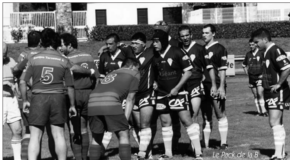
Le Pack de la B

Le site officiel du challenge de l'Essor est formel : nos deux équipes terminent deuxièmes de leur poule et sont qualifiées toutes les deux pour les huitièmes de finale qui doivent officiellement avoir lieu le samedi 10 novembre sur terrain neutre. L'équipe Une se retrouve classée derrière Mazamet et profite du nombre élevé d'essais marqués, notamment grâce (ou à cause) de la large victoire obtenue au FCTT amoindrie. L'équipe 2 profite, pour sa part, de nombreux forfaits de la poule pour se retrouver juste derrière Lombez Samatan.